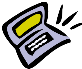
I più piccoli della scuola

chierare nella classe dei più grandicel-