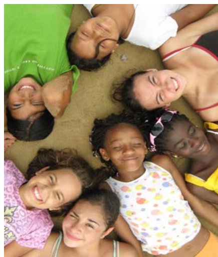
Alcune ragazze della nostra scuola

Ma a volte, quando noi ragazze giochiamo a calcio con i ragazzi, i maschi vincono sempre, ma chi si fa più male sono proprio loro, perché la palla va sempre nel loro punto basso ed intimo... Così imparano a non volere che giochiamo con loro!!!! Però, alla fine, ci divertiamo sempre tutti, anche se non stiamo per forza tutti quanti insieme.